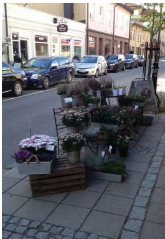
Placering i möbleringszon.

Föreskrifterna gäller allt från ogräs och skräp till snö, is och sand, samt att inte någon sanitär olägenhet för människors hälsa uppstår och att eventuella rännstensbrunnar hålls fria. Fastighetsägarna ansvarar även för föremål som placeras ut vid gångbanorna, såsom butiksskyltning.