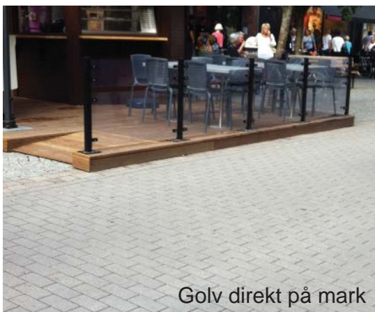
Golv direkt på mark

även för personer med olika former av funktionsnedsättning, så var tydlig i din utformning. En uteservering får inte bli ett hinder för framkomlighet. Det ska gå att ta sig fram med rullstol och rollator. Skarpa hörn bör avlägsnas genom lämplig typ av sarg för att undvika olägenhet för synskadad.