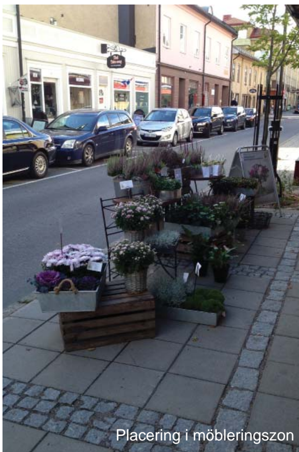
Placering i möbleringszon

Riktlinjerna är en vägledning för fastighetsägare i Arvika att enkelt kunna följa gällande ordningsföreskrifter och därmed bidra till ett välskött och ordnat centrum.